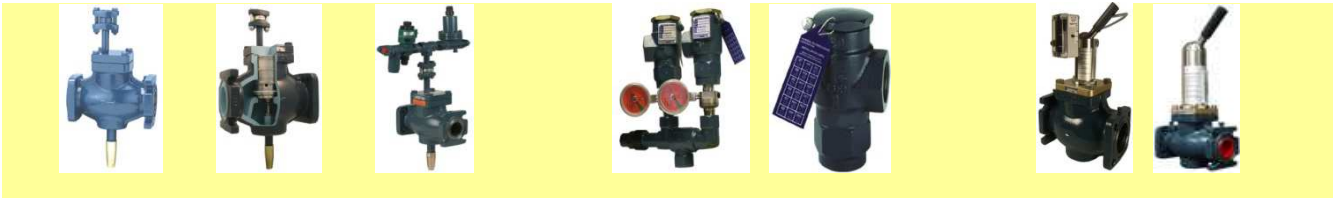
7. Regulatori nivoa sa plovkom i elektronski