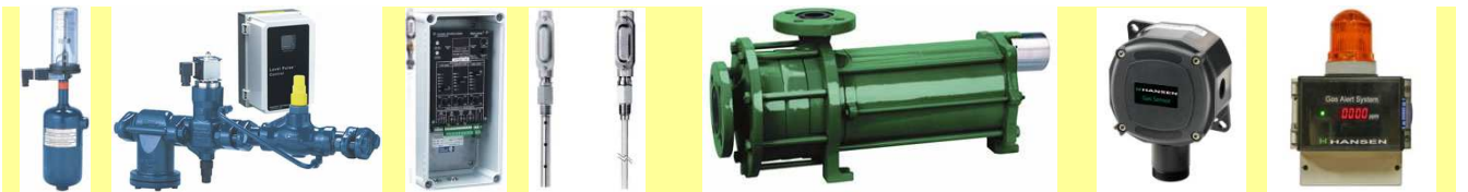
9. Auto purgeri (NH 3 , Freon)